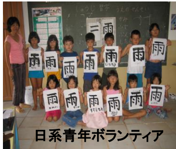
日系青年ボランティア