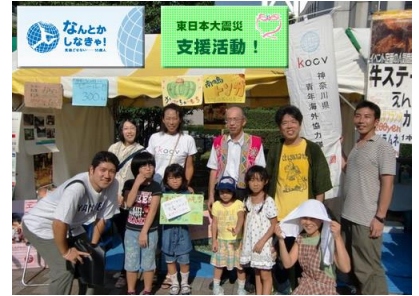
JICAボランティア経験者